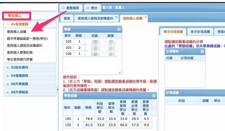
【附圖二】如何查詢中正高中班級暨教師的課表

點開畫面左方的 [01 各項查詢] 點選 [查詢個人成績] 或 [查詢個人請假及 缺曠資料] 便可查詢 學生各項成績及出缺 勤資訊